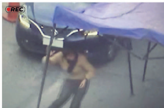
Instalación de toldos azules en calle Eyzaguirre.

Lamentablemente, el domingo 9 del mismo mes, un funcionario de la Dirección de Inspecciones que fiscalizaba la venta ilegal de cigarrillos en una feria de la comuna, recibió un corte con arma blanca en su brazo izquierdo.