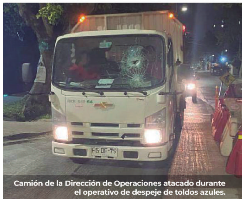
Camión de la Dirección de Operaciones atacado durante el operativo de despeje de toldos azules.